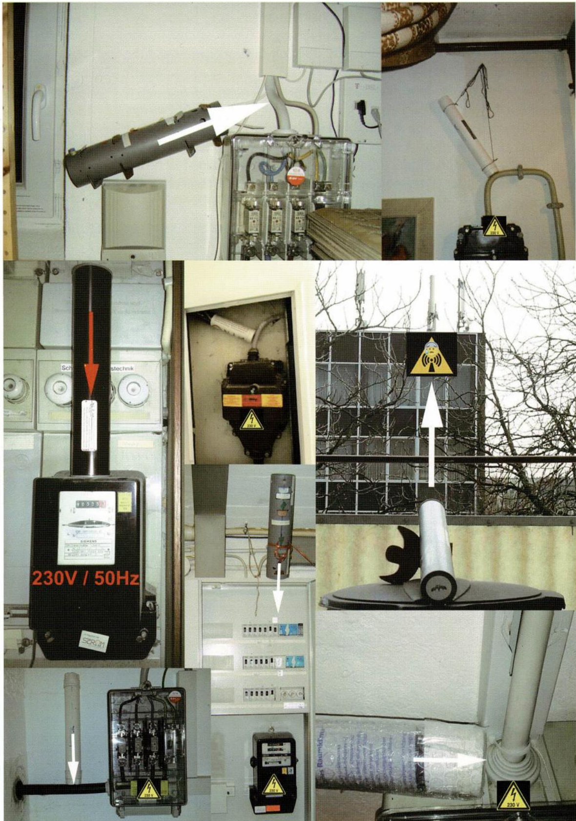
Rechts oben hier wird sogar ein MHR in Richtung Mobilfunkmasten ausgerichtet gezeigt.